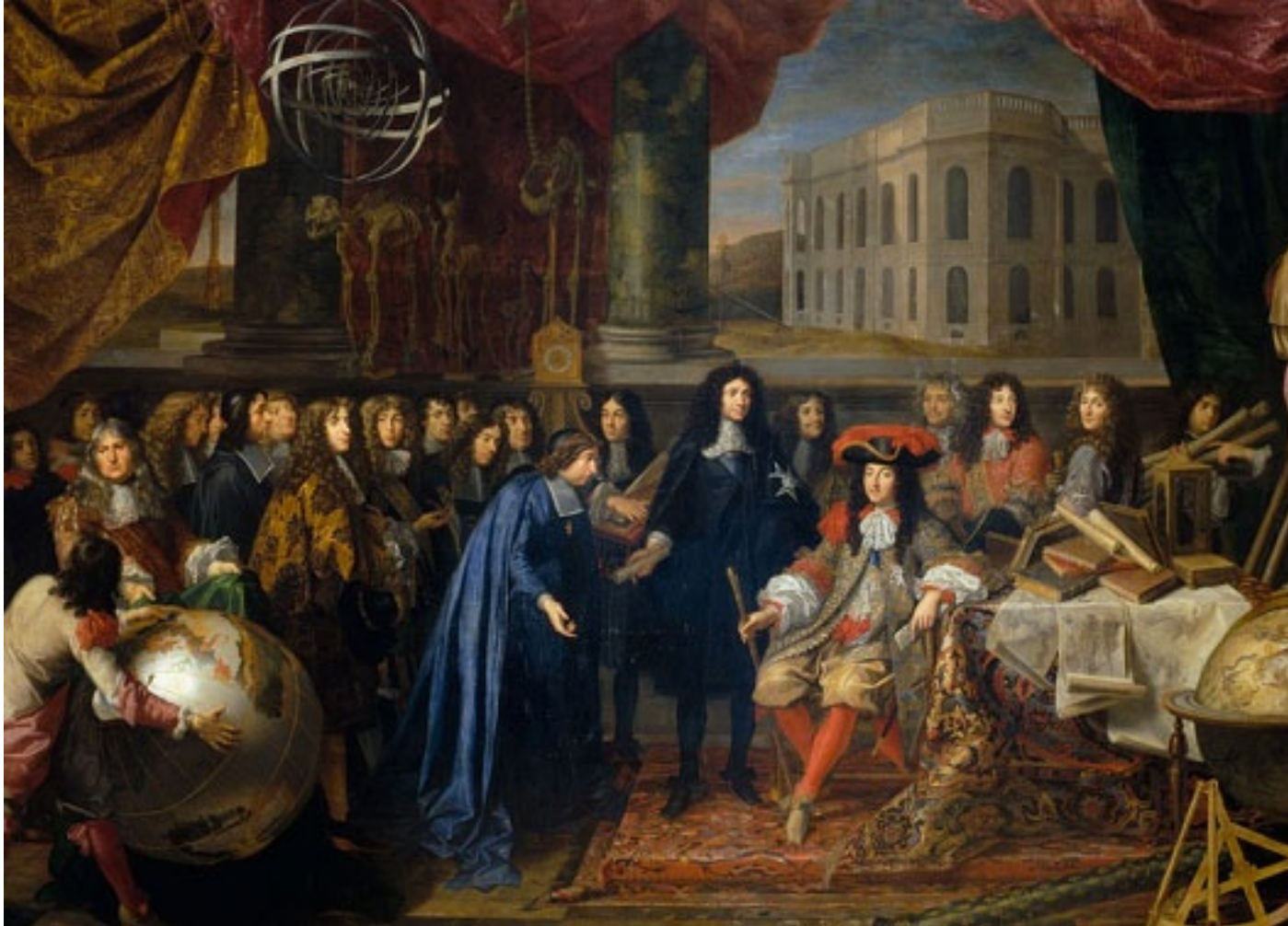
1650, Colbert, le premier Ministre, présente au roi Louis XIV les membres de l'Académie des Sciences