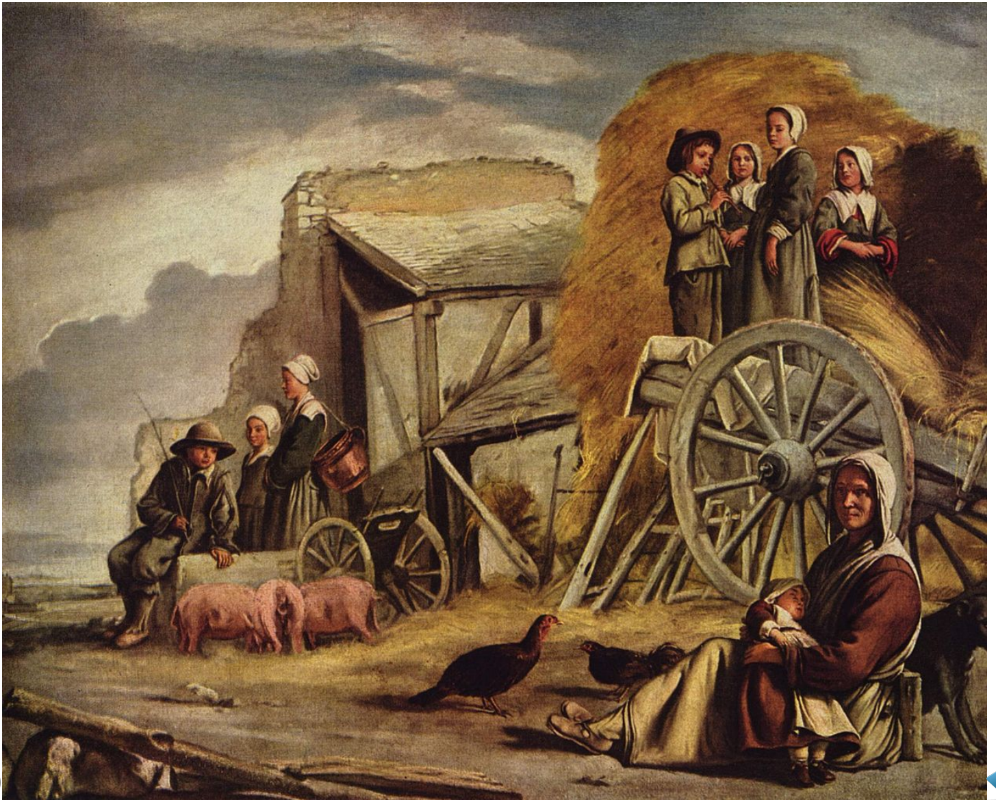
XVIIe siècle / paysans